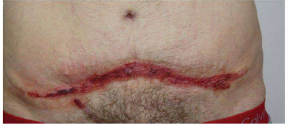
imediat dupa tratament