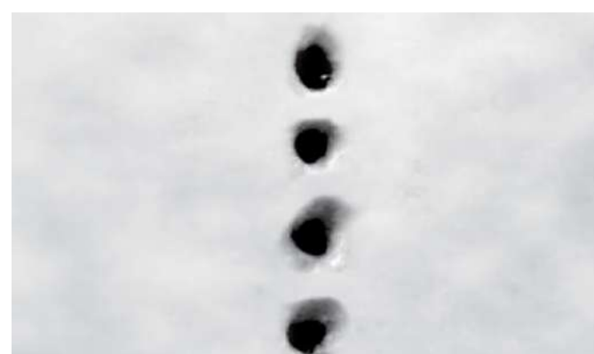
Punctii precise, extrem de mici, realizate cu acele de mare precizie Amiea Med EXCEED