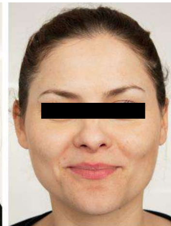
dupa 3 zile