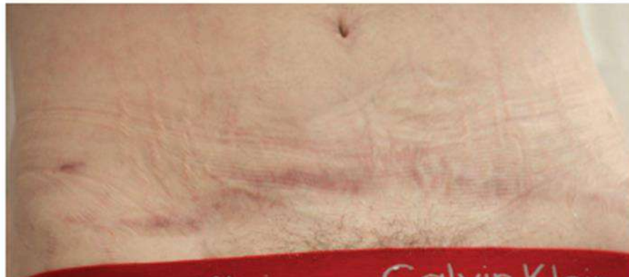
7 saptamani dupa tratament