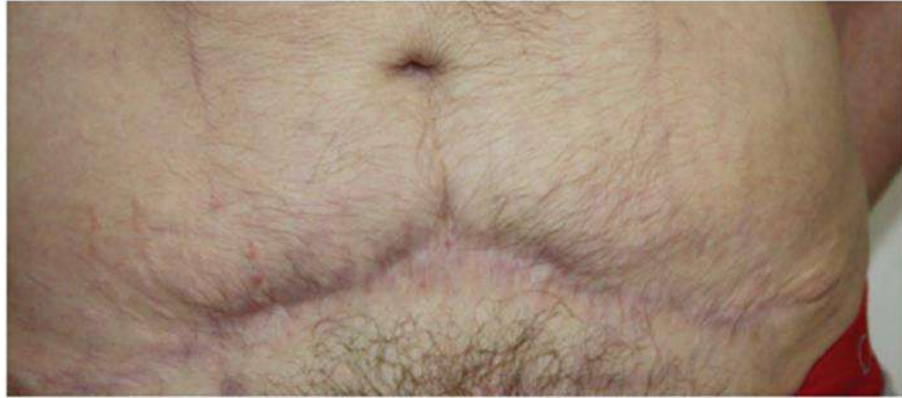
Inainte de tratament