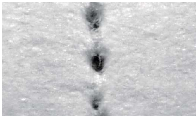
Punctii mari, zdrentuite realizate cu un dispozitiv obisnuit