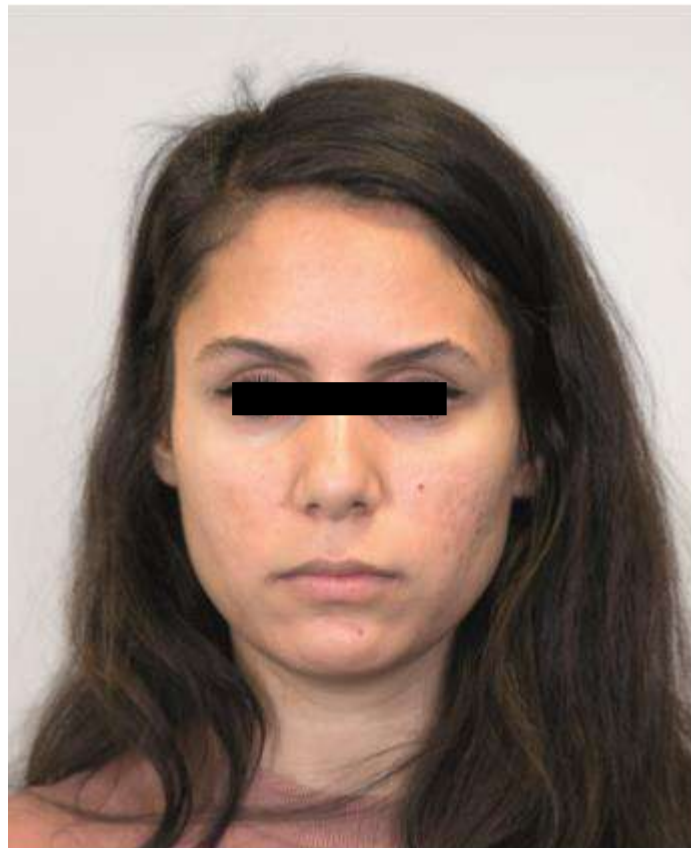
La 7 zile de la tratament